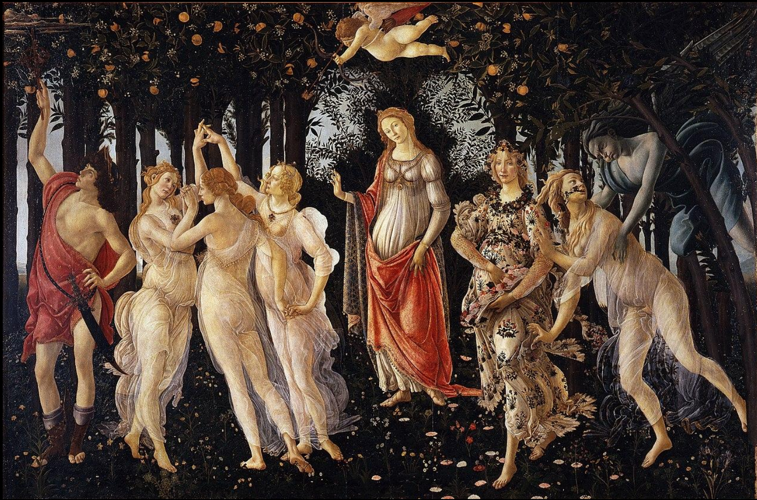
Sandro Botticelli, Primavera, 1480, Tempera su tavola, 207 x 319 cm, Galleria degli Uffizi, Firenze