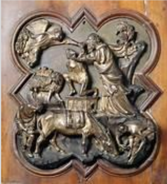
Filippo Brunelleschi Sacrificio di Isacco 1401 Firenze