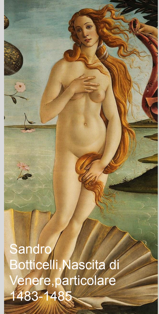
Sandro Botticelli, Nascita di Venere, particolare 1483-1485

La Venere di Botticelli è ispirata alla Venere pudica, spesso frequente in età antica. Dea che posa sinuosa.