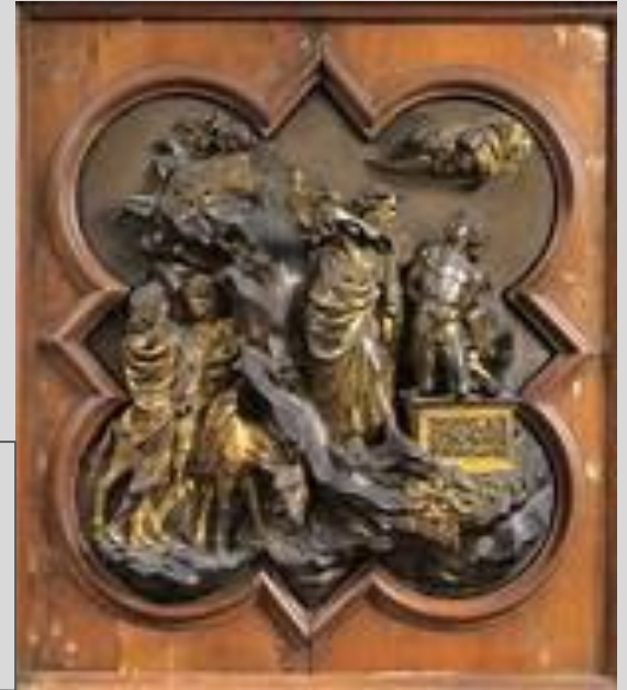
Lorenzo Ghiberti Sacrificio di Isacco 1401 Firenze