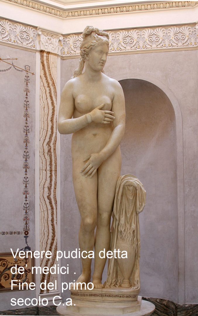
Venere pudica detta de' medici . Fine del primo secolo C.a.

La Venere di Botticelli è ispirata alla Venere pudica, spesso frequente in età antica. Dea che posa sinuosa.