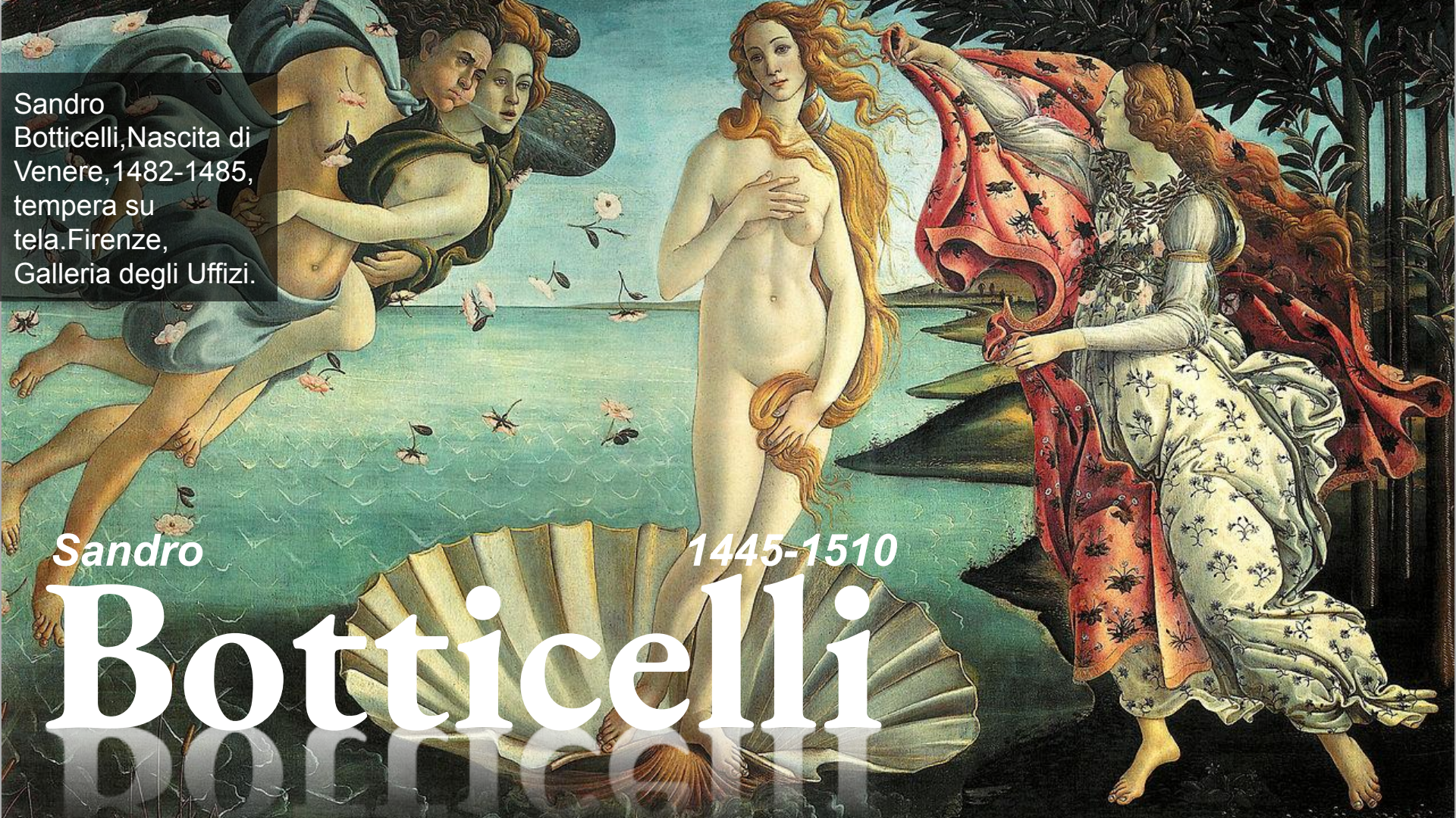
Sandro Botticelli, Nascita di Venere, 1482-1485, tempera su tela. Firenze, Galleria degli Uffizi.